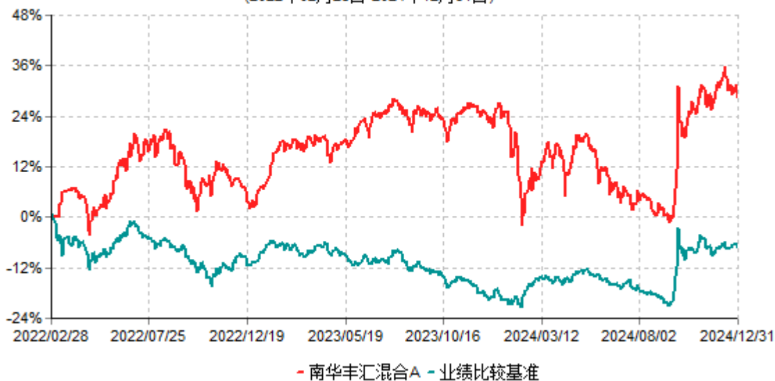
南华丰汇混合A累计净值增长率与业绩比较基准收益率历史走势对比图 (2022年02月28日-2024年12月31日)