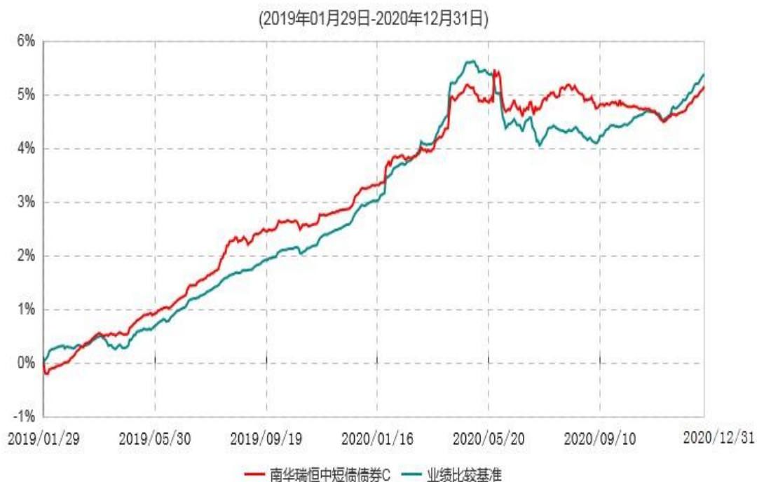
南华瑞恒中短债债券C累计净值增长率与业绩比较基准收益率历史走势对比图

(2) 南华瑞恒中短债债券 C 基金份额累计净值增长率与业绩比较基准收益率的历史走势对比图（2019 年 1 月 29 日至 2020 年 12 月 31 日）